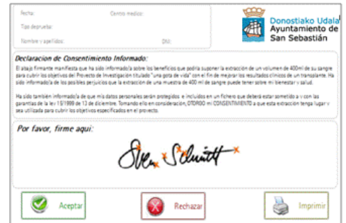
Personalización fondo de la tableta

2. Se activa la tableta y muestra al ciudadano los datos necesarios para facilitar la comprensión y la firma del documento.